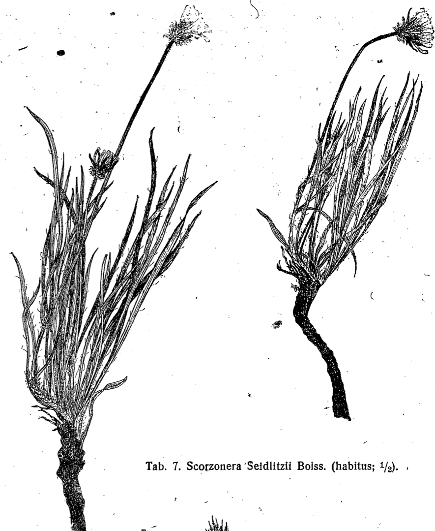
Tab. 7. Scorzonera Seidlitzii Boiss. (habitus; 1/2).

Многолетник с многоглавым корневищем образует дернину, корневые шейки ± покрыты влагилицами, снаружи одетыми белой шерстью. Стрелки приподнимающиеся, 7,5—10(15) см высоты (включая корзинки), тонкие бороздчатые, слегка опушенные (опушение позднее стирается), однокорзинчатые, с несколькими (1—3) щетиновидными листочками. Прикорневые листья многочисленные, нитевидно-линейные, весьма узкие, 0,5—1 мм, на конце туповатые, слабо опушенные или почти голые. Корзинки обратно-конические 1,3—1,6 см длины. Обертка слабо опушенная.