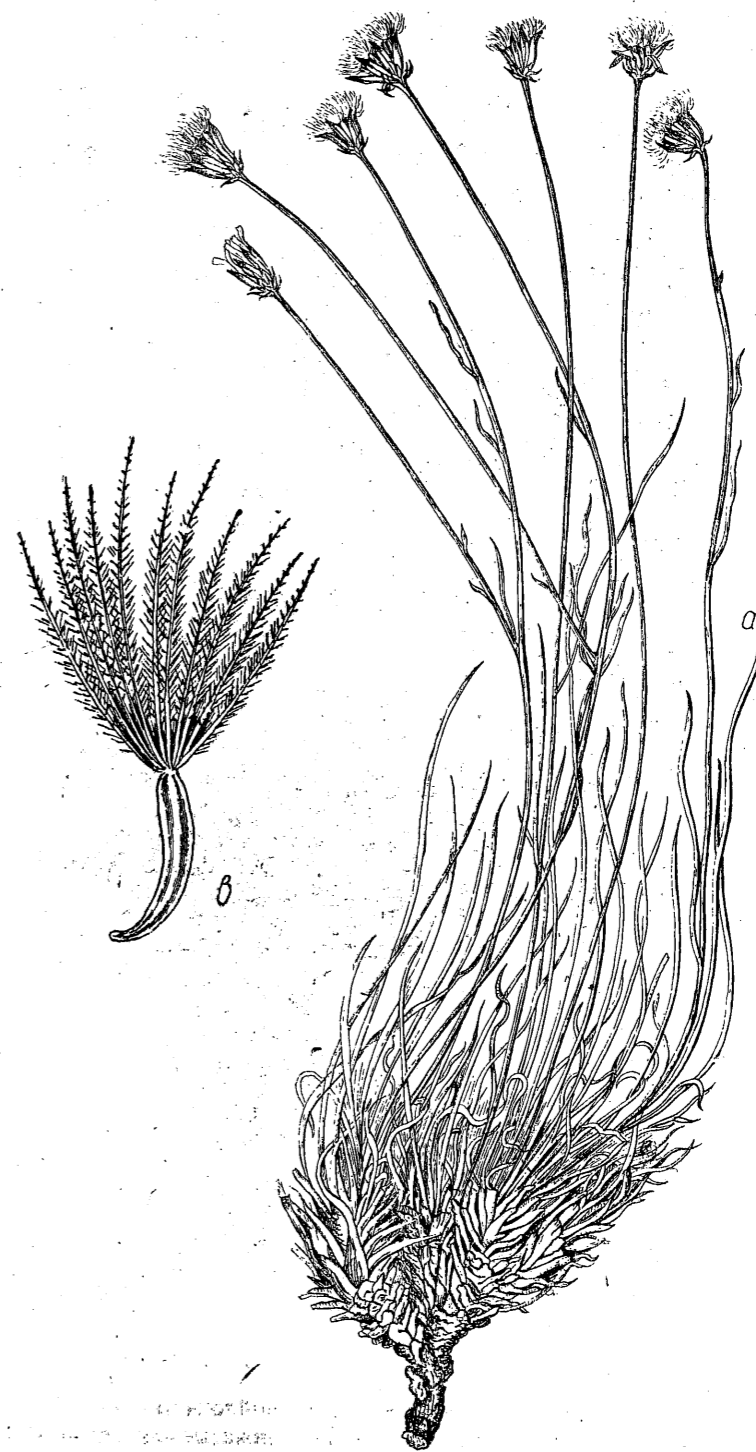
Tab. 10. Scorzonera rigida Auch. a) habitus ( \frac{1}{2} ); b) achenium ( \times 4 ).