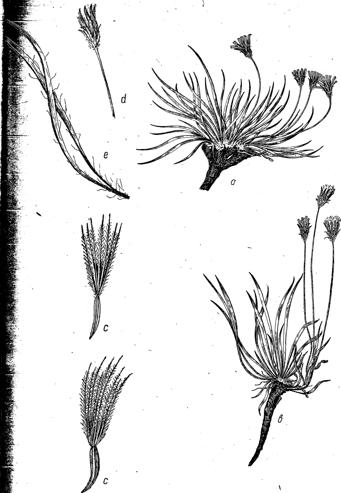
Tab., 6. Scorzonera Seidlitzii Boiss. a—b) habitus ( \frac{1}{2} ); c) achenium ( \times 4 ); d) capitulum fructiferum ( \frac{1}{1} ); e) folia ( \frac{1}{1} ).

Многолетник, б. ч. с несколькими каудексами, слагающими дернину, у основания корневой шейки с многочисленными чешуями. Прикорневые листья линейные, плоские или желобчатые, 1,5—2,5 мм ширины, к верхушке слегка стянутые, с многочисленными, длинными, извилистыми, нередко перепутанными, отстоящими