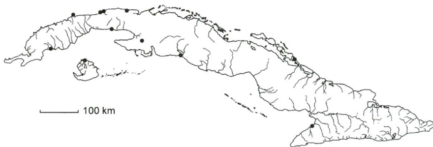
Mapa 1. Ruppia maritima L.

Distribución: Casi cosmopolita, mayormente en costas marinas. Presente en Cuba occidental: PR (Playa La Salina en San Luis; Bahía Honda), Hab (Batabanó; Río Jibacoa), C Hab (playa de Marianao), Mat (Ciénaga de Zapata), IJ (Los Indios; Nueva Gerona), Cuba central: Ci (Castillo de Jagua), Cam (Cayo Guayaba) y Cuba oriental: Gr (Manzanillo). En aguas saladas o salobres de playas arenosas, costas fangosas, bosques de mangles o lagunas costeras. Constituye un importante alimento y abrigo para invertebrados, peces y aves marinas (Kantrud 1991). – Mapa 1.