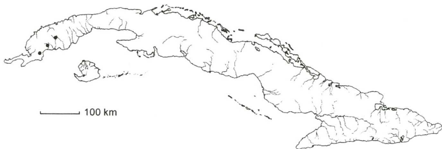
Mapa 1. Osmunda cinnamomea L.