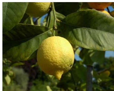
„Die Goldenen Äpfel“ in Branitz – unsere Sonderausstellung zu Zitrusgewächsen auf Reisen