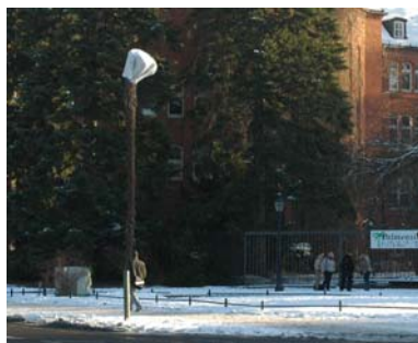
Wie geht es den Chinesischen Hanfpalmen im Schnee?