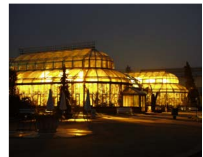
Vorschau Februar: Palmensinfonie - Livemusik in den beleuchteten Gewächshäusern