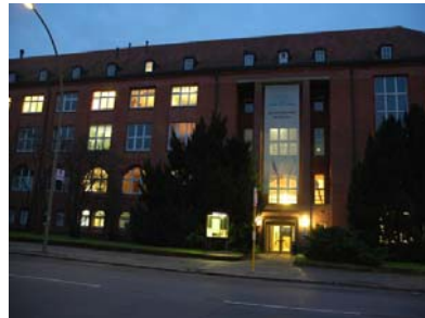
Lange Nacht der Museen im Botanischen Garten am 31. Januar