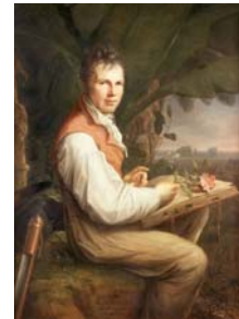
Interessante Vorträge und Führungen in den nächsten Tagen