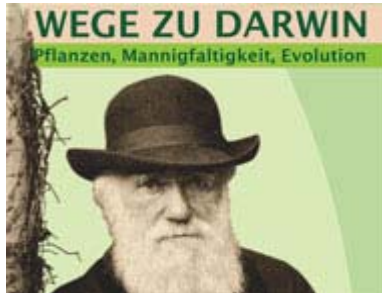
Darwinjahr 2009 im Botanischen Garten und Botanischen Museum