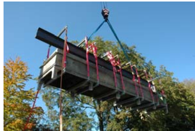
Das Bauen geht weiter dank Konjunkturpaket II - Seltene Pflanzen aus der Namib hängen am Kran