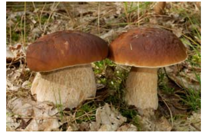
Kostenlose Pilzberatung, bis Oktober, Mo + Di + Do 14-16 Uhr