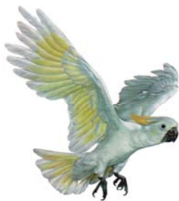
Vogelschau im Botanischen Garten, 16.-18. Oktober 2009, 9-17 Uhr