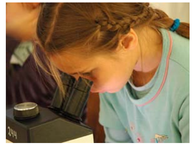
Vorschau November – Mikroskopierworkshop für Kinder im Darwinjahr und Berliner Märchentage