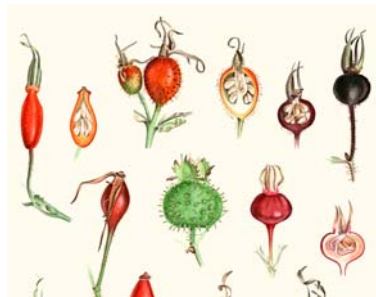
Botanische Zeichnungen und Aquarelle von Bernd Schulz, Ausstellung im Botanischen Museum ab 7. Oktober