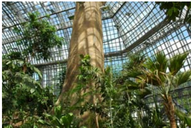
Großes Tropenhaus wieder geöffnet: Erlebnis der globalen tropischen Pflanzenvielfalt