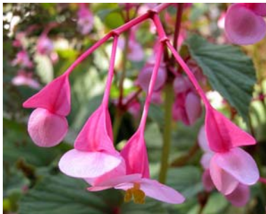
Weibliche Blüten der Winterharten Begonie