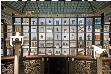
Regalininstallation im Lichthof