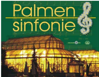
Palmensinfonie - Wandelkonzerte mit klassischer Musik, 12. + 13. / 19. + 20. / 26. + 27. Februar / 5. + 6. März 2011