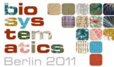
BioSystematics Berlin 2011: Congress - Meeting - Symposium, Internationaler Fachkongress, 21.-27. Februar 2011