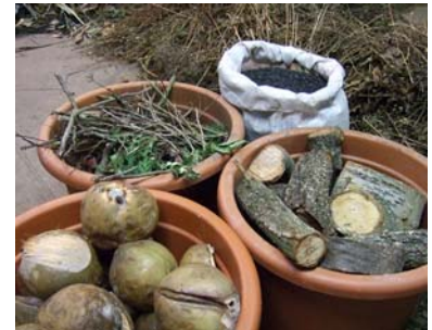
Wertvolle Erde der Indios: Wegweisendes Pilotprojekt zur Herstellung von Schwarzerde im Botanischen Garten ange- laufen