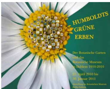
Sonderausstellung verlängert bis 27. Februar 2011: Humboldts Grüne Erben – Der Botanische Garten und das Botanische Museum in Dahlem 1910 bis 2010