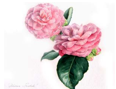
Vorschau März: Neue Galerieausstellung im Botanischen Museum