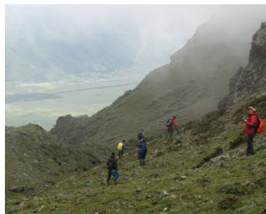
Expedition in China, Tagungstipp Pilzberatung, spannende Führungen, Auszeichnung für Klimaschutz und Bericht in den Medien