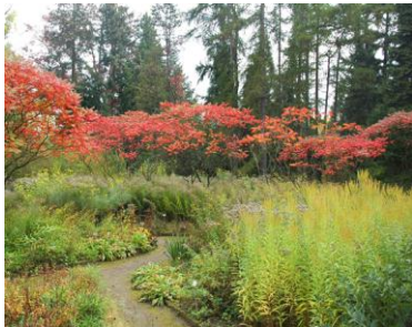
Buntes Herbstlaub, herbstblühende Kamelien und Pflanzzeit in den Alpen