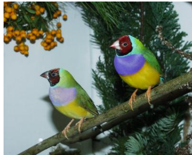
Vogelschau im Botanischen Garten: von Ara bis Zebrafinken, 19.-21. Oktober 2012