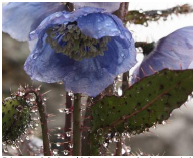
Blauer Mohn ( Meconopsis betonicifolia )