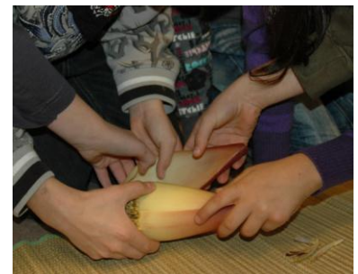
Vorschau November: Workshop für Kinder ab 8 Jahren