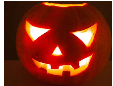
Viel Spaß beim Halloweenfest für die ganze Familie mit Kürbisschnitzen, Kindertheater, Gruselkabinett und vielem mehr am 28. Oktober 2012