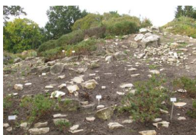
Insubrische und Bergermasker Alpen