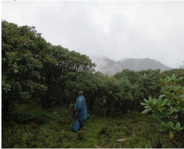
Pflanzen sammeln im wolkenverhangenen Rhododendronwald

repräsentiert ist. Daher wurden dort auch Pflanzen außerhalb der taxonomischen Schwerpunkte des Berliner Botanischen Gartens gesammelt und für künftige Forschung verfügbar gemacht. Die Reise führt zu einer wertvollen Erweiterung der Berliner Sammlungen: über 1100 Herbarbelege wurden in mehreren Sätzen angelegt. Zusätzlich wurden 470 mit Silika-Gel getrocknete Blattgewebeproben zur DNA-Extraktion für molekulare Untersuchungen gesammelt. Die Ausläufer des Monsuns sorgten für sehr feuchtes Wetter und die beste Blütezeit – doch mussten die Pflanzenbelege demzufolge sehr gründlich getrocknet werden um sie vor dem Verschimmeln zu wahren.