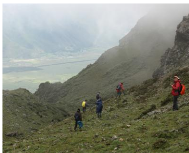
Chinesische und Berliner Botaniker auf gemeinsamer Sammelexpedition im Südwesten Chinas