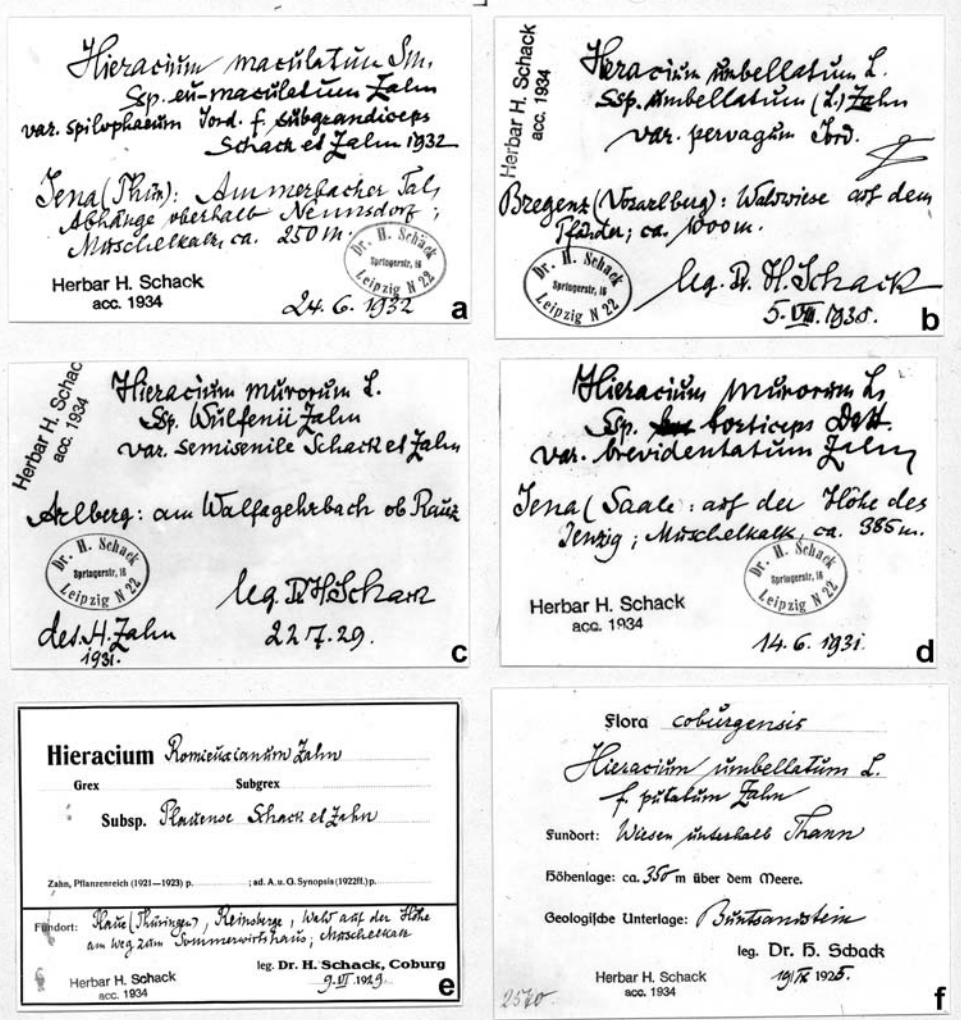
Fig. 3. Etiketten aus dem Herbarium von Hans Schack mit seiner Handschrift. Mit einem "Z" hat K. H. Zahn die ihm vorgelegenen Belege versehen. Die Angabe "Herbar H. Schack, acc. 1934" wurde im Botanischen Museum Berlin-Dahlem aufgestempelt.

che Betreuung des von Otto Behr in Forst herausgegebenen Exsikkatenwerkes "Herbarium Hieraciorum". Noch im Jahre 1944 wurde ihm von Rothmaler die Übernahme der Gattung Hieracium für die von diesem initiierte "Flora von Europa" angetragen, ein Angebot, das Schack mit Hinweis auf seinen schlechten Gesundheitszustand und den vermeintlichen Untergang seiner Sammlungen in Berlin-Dahlem, resignierend ablehnte (6).