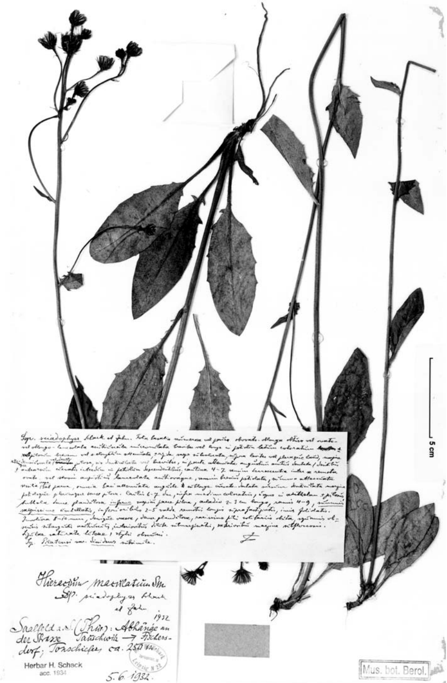
Fig. 5. Typus von Hieracium maculatum subsp. sciadophyes Schack & Zahn mit handschriftlicher Diagnose von K. H. Zahn.