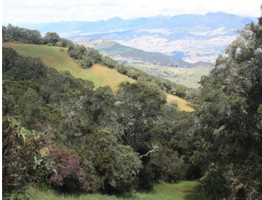
Landschaft nahe Bogotá mit Fragmenten Andinen Bergregenwalds