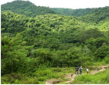
Tropischer Trockenwald nahe Barranquilla, zur Regenzeit saftig grün