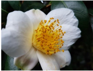
Camellia japonica ‚Kyo Nishiki‘